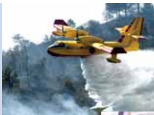
VIBE le fue dado a bomberos luchando contra incendios en la Costa Oeste para ayudarlos a mantenerse fuerte.*