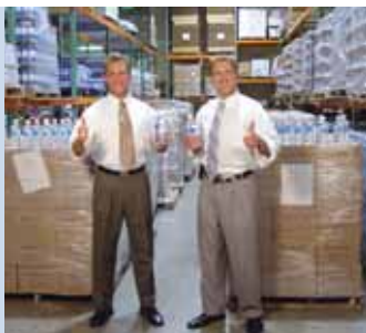
Eniva donó tráilers llenos de agua críticamente requerida y suplementos para víctimas de varios huracanes en los Estados Unidos en el 2005.

Con la revolucionaria innovación de VIBE®, invitamos a cada uno de ustedes leyendo ésta guía a formar parte de nuestra Visión y compartirla con aquellas personas importantes en sus vidas.