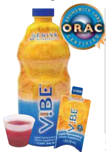
Valor de Capacidad Antioxidante (ORAC)

VIBE es un Antioxidante Certificado por Brunswick Laboratories.™