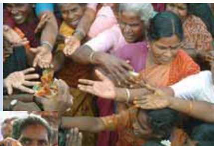
Eniva Corporation y sus miembros han donado suplementos nutricionales vitales a víctimas del desastre del Tsunami.